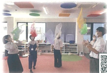
松江総合ビジネスカレッジ