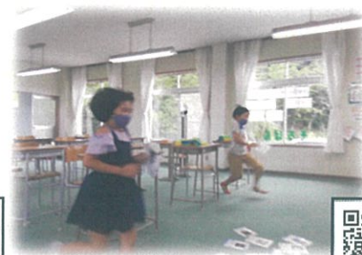
つぼうち英会話スクール