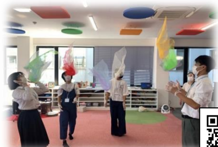
坪内総合ビジネスカレッジ

11月6日(日) 松江:出雲郷校、川津校 幼児 9:00~9:45 小1から小3 10:00~11:00 小4から小6 11:30~12:30