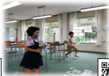
つぼうち英会話スクール