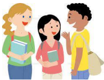
国際キャンパス・国際日本語学科