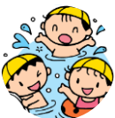
坪内学園附属認定こども園